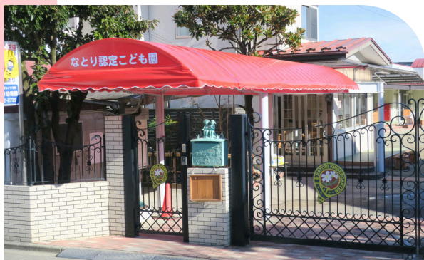
なとり認定こども園 幼稚園部

所在地：名取市増田3丁目8番8号 利用定員：210名(1号認定)・145名(2号認定) ☎ 022-382-2735