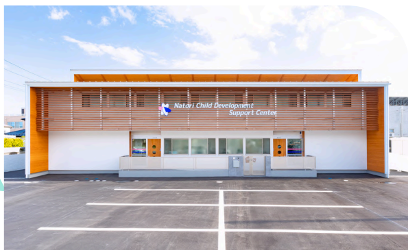
なとり児童発達支援センター

所在地：名取市手倉田諏訪284 利用定員：72名(3号認定) ☎ 022-797-4921