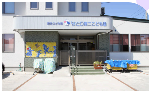
なとり第二こども園 保育園部

所在地：名取市手倉田諏訪276 利用定員：270名(1号認定)・108名(2号認定) ☎ 022-384-1923