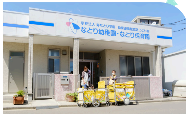
なとり認定こども園 保育園部

所在地：名取市増田3丁目8番8号 利用定員：210名(1号認定)・145名(2号認定) ☎ 022-382-2735