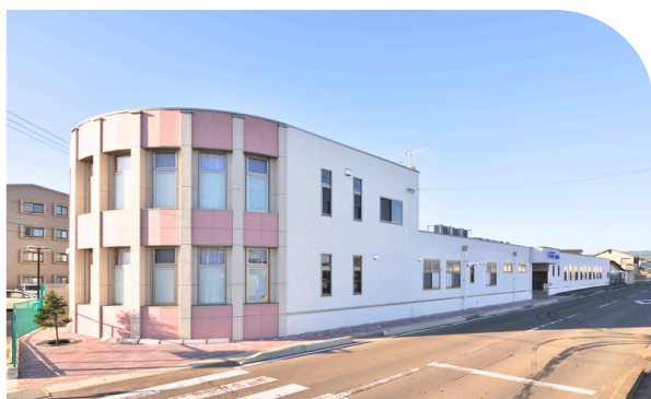
なとり第二こども園 幼稚園部

所在地：名取市増田3丁目7番28号 利用定員：60名(3号認定) ☎ 022-384-1123